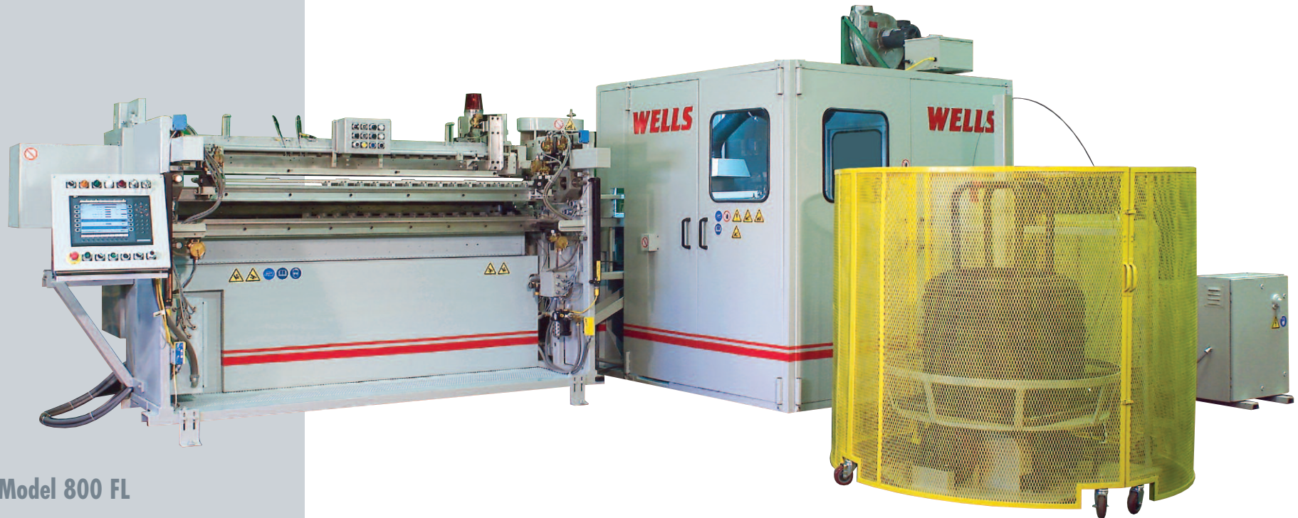
Model 800 FL

Die 300 HS Federwindmaschine und Drahtspindel werden von Frequenzregler-Motoren kontrolliert. Die Montagemaschine kann optional mit zusätzlichen Öszangen ausgestattet werden um schnell auf andere Größen umgestellt werden zu können. Eine Vielzahl von Federdurchmessern und -höhen kann mit der Transfermaschine gefertigt werden.