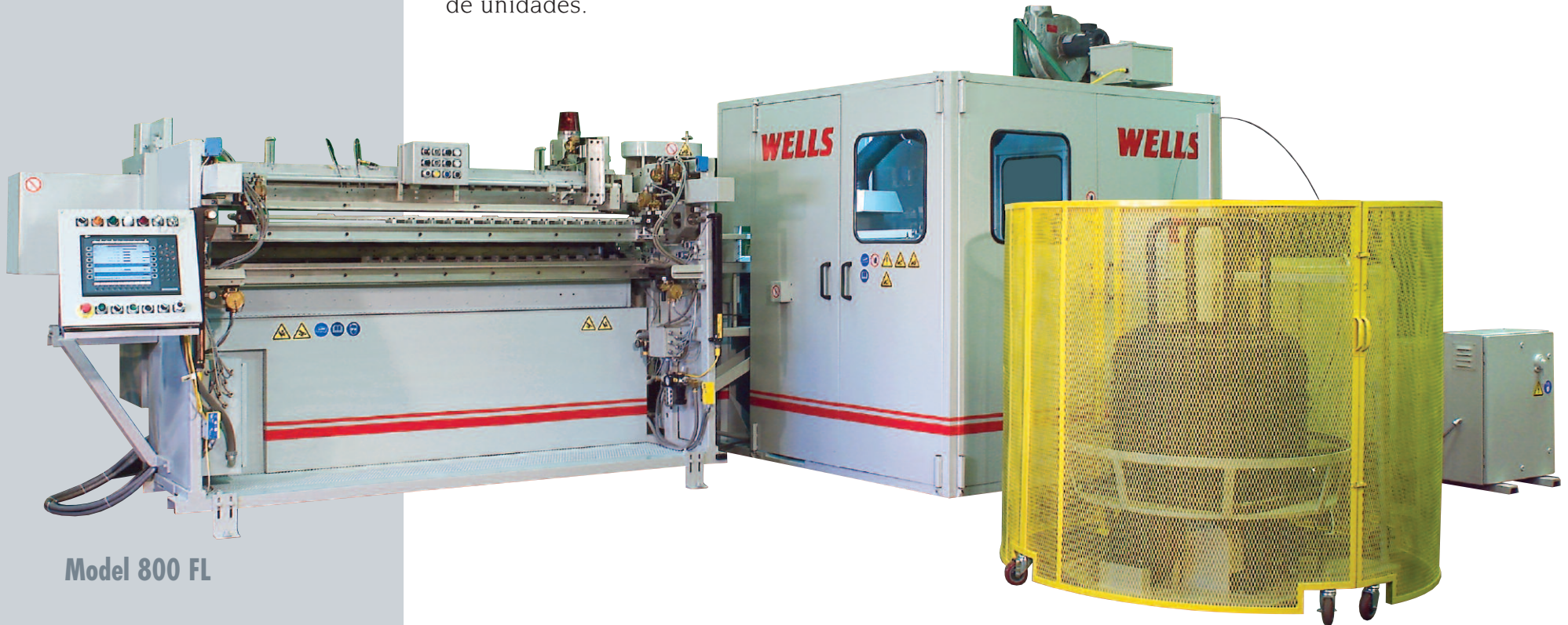
Model 800 FL

Muchos tamaños de unidades con diámetros diferentes y alturas pueden ser acomodados en los diferentes modelos de máquinas de transferencia.